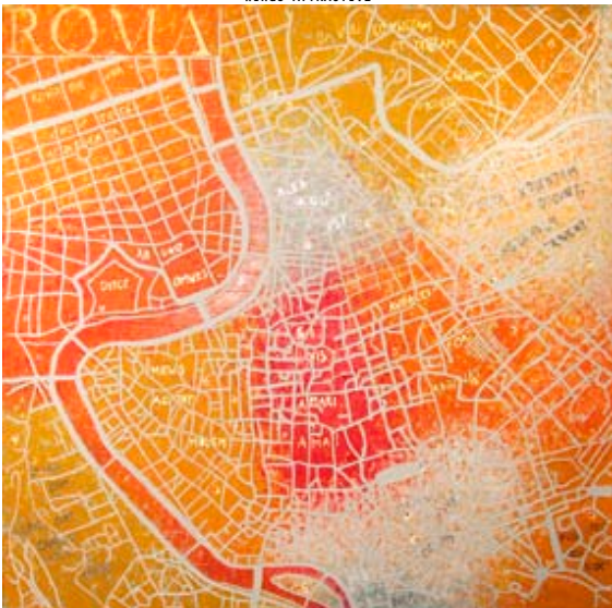
WHAT GAVE US ROMA