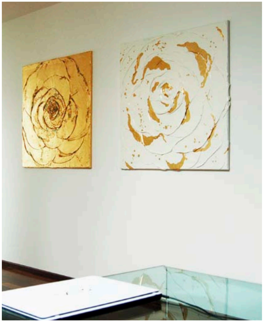
NO COMPROMISES THE BIG GOLDEN ROSE